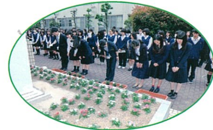
決意を込めてベゴニアを植えました。