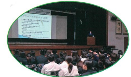
看護師のめざすべき理想について考えました。