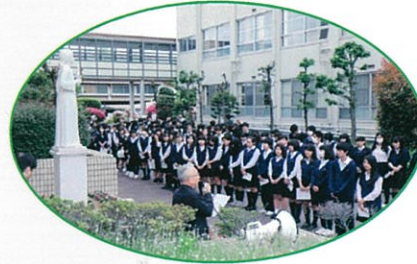
ナイチンゲール誓詞を全員で唱和しました。