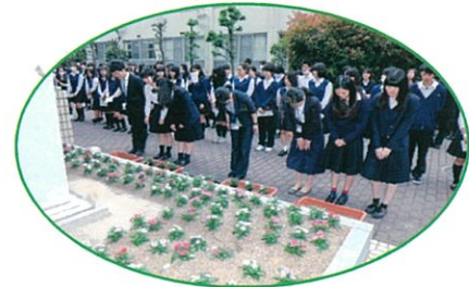
決意を込めてベゴニアを植えました。