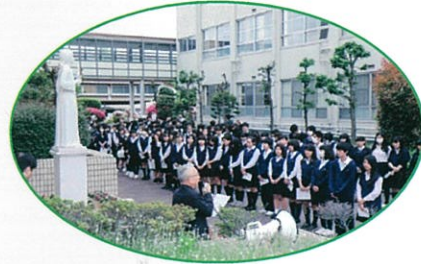
ナイチンゲール誓詞を全員で唱和しました。